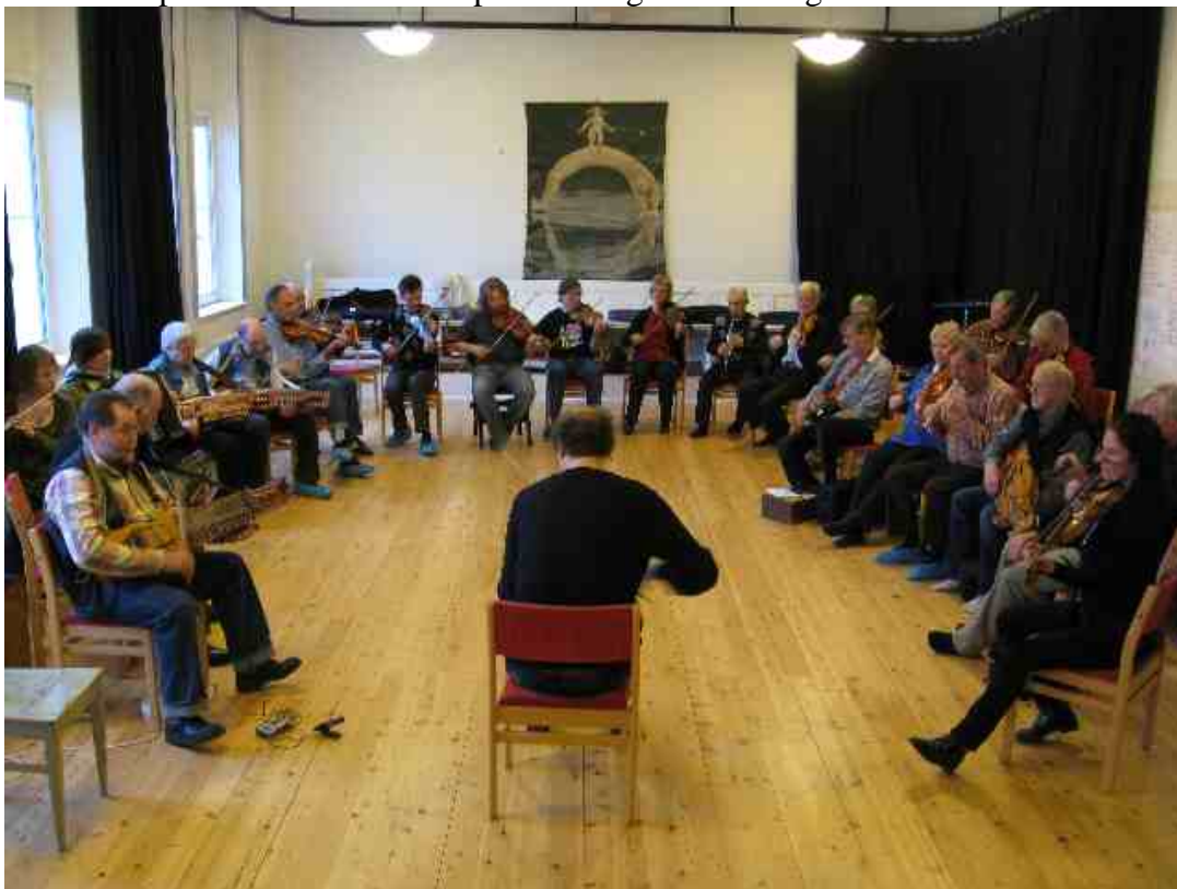
Sven visar hur foto Michael Müller

I den, valsen närliggande, hambopolketten dvs mazurka ser noterna väldigt lika ut som vals, men spelas stuttigare, spetsigare med korta accentuerade stråk. Den enklaste formen av dans, en slags universalpolska, är polketteringen. Den utförs med ett tresteg på varje taktadel i det att man vänder ett halvt varv för att ta ett nytt tresteg(dvs ett steg på varje taktadel). Det blir polka eller schottissteg om man dansar det i två- eller fyrtakt och det blir mazurka om man dansar det i tretakt med ett hopp i. Till polska kan man dansa detta steg både snabbt och långsamt beroende på musiken. Man har även använt denna polkettering som en slags viltur i det vanliga polskesnurrandet med andra steg. Både äldre polskor som dansas till sextondelslåtar som yngre ska bondpolskor som dansades till åttondelpolskor förevisades. Sammanfattningsvis kan vi konstatera att många lokala danser finns beskrivna och vi spelmän har en hel del att fundera på hur vi bäst fångar rytmik och tempo och sedan uttrycker det i låtarna vi spelar till dans. Kunskap om dans ger bra näring åt det funderandet.