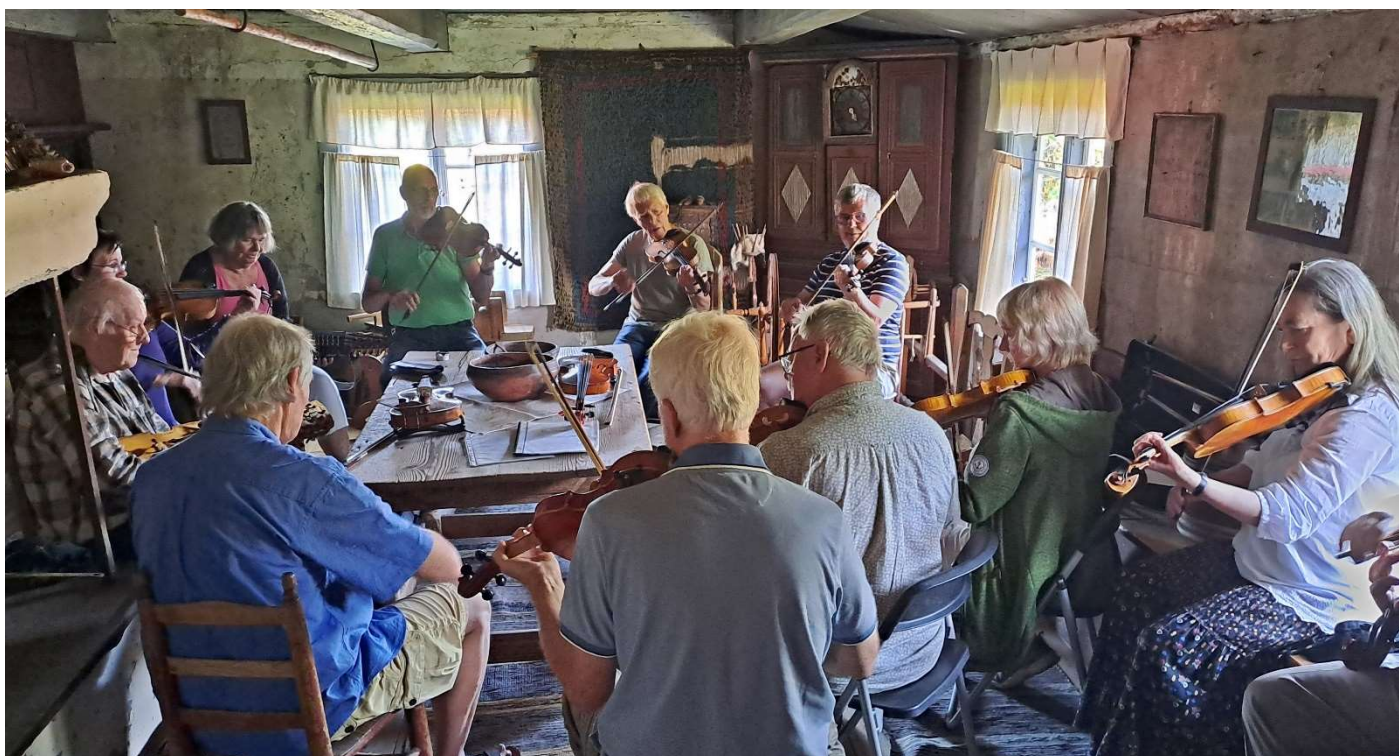
Ovan: Spelträff i Koversta 9 juli.